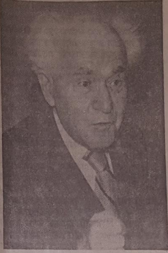
השקפה כותנית, בן-גוריון