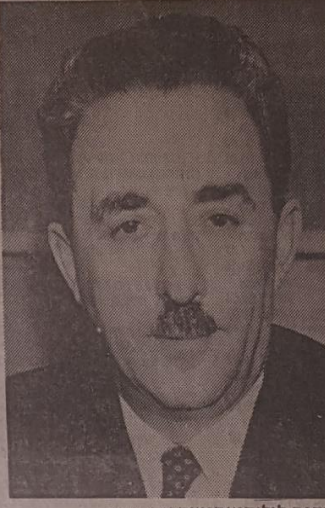
השקפה גלגלית-מוסרית, שרת

ואבק כפול זה, אשר מבחינה מהותית וטקסטית יד היווה שני צדדיו של אותה מטבע, איפיינ במעץ